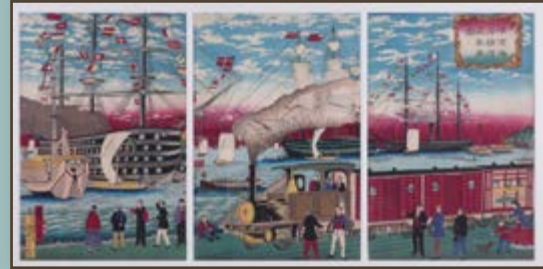
Cinco actores de teatro y una locomotora de vapor, Toyohara Kunichika, 1871