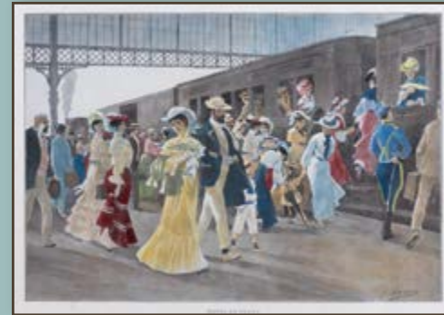
Hacia la playa, s. XIX