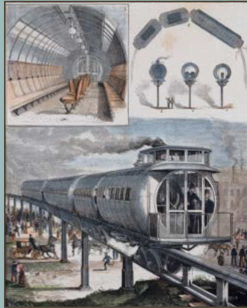
Ferrocarril Aéreo, sistema Mejos, s. XIX

A lo largo del tiempo, los sistemas ferroviarios han evolucionado desde la tracción animal, pasando por las locomotoras de vapor con su impresionante desarrollo, hasta las actuales técnicas de tracción eléctrica que hoy consiguen que