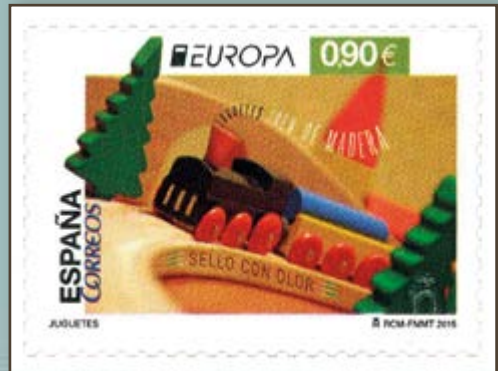
Sello de correos. Juguetes. 2015. MCM